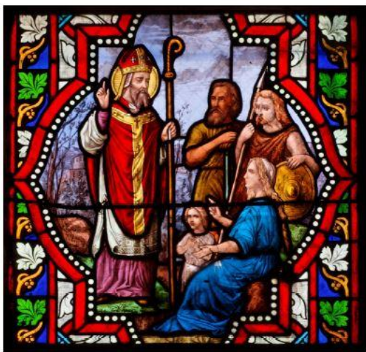
Détail du vitrail central de l'église Saint-Denis de La Norville

Nous serions heureux de vous compter parmi nous à l'occasion de la fête de notre Saint-Patron le Dimanche 15 octobre à 10h30 à La Norville en l'église Saint-Denis.