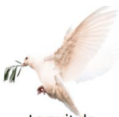
La nuit de l'Esprit-Saint

Lors de la Nuit de l'Esprit-Saint le vendredi 3 juin 2022, l'Esprit Saint n'était pas pressé d'aller se coucher : la Prière des Frères a duré jusqu'à minuit 15 et le sacrement de réconciliation jusqu'à 1h30 du matin.